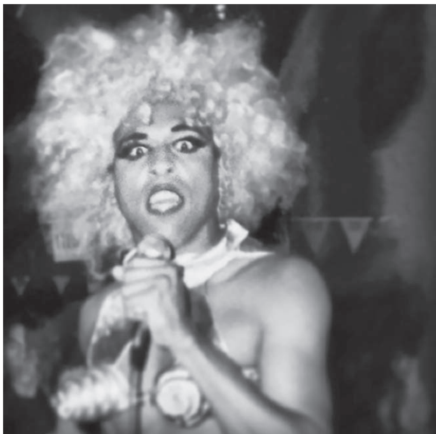
Vaginal Davis nosi nedrček iz zgodnjega videa Pat Benatar.

Odjebi, fašizem! izpodbija konvencionalne domneve o tem, kaj je mogoče storiti s politično spolnim. To bom poimenovala trans* destrukcija. Ne gre več za preoblikovanje draga kot performativnosti moči in jeze par excellence , temveč za uničenje tistega, kar bi moralo biti uničeno že vsaj stoletje nazaj: kolonialni spomeniki, rasistične strukture, režimi bele nadvlade. Trans* destrukcija je kot bes. Sklicujem se na »kvir bes« Susan Stryker, saj je trans* radikalnost motnja naturalizacije vsakršnih konvencij v našem spominu in zgodovini kot tudi v umetniškem izražanju. Susan Stryker (2004: 214) pravi, da je trans* teorija zlobni dvojček kvir teorije zaradi svoje posebne občutljivosti za načine vključevanja nezahodnih identitet v evroameriški privilegij.