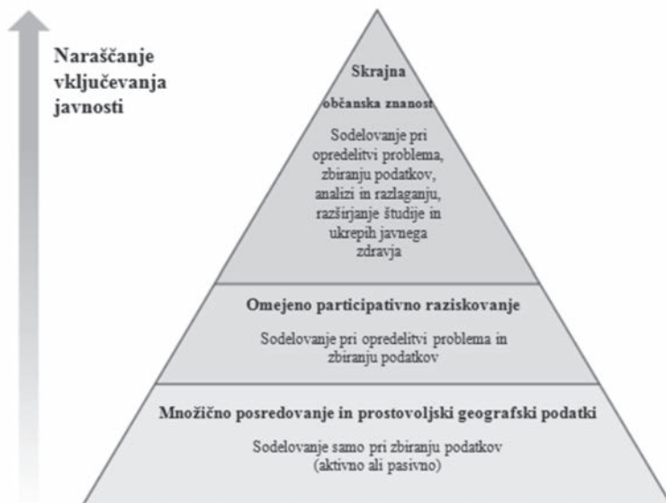
Shema 3: Piramida participativnega (sodelovalnega) raziskovanja.

Vsebinsko podobna je piramidalna predstavitev naraščanja vključevanja javnosti, kot se pogosto pojavlja v relevantni literaturi.