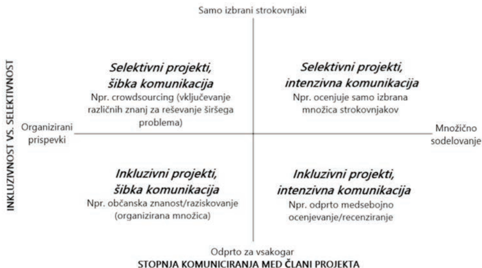
Shema 4: Širjenje občanskega raziskovanja. Prirejeno po Uhlmann in drugi, 2019: 715.

strokovnjaki, do popolne odprtosti za vsakogar. Pri tem upoštevamo stopnjo povezanosti znotraj postavljenih projektov.