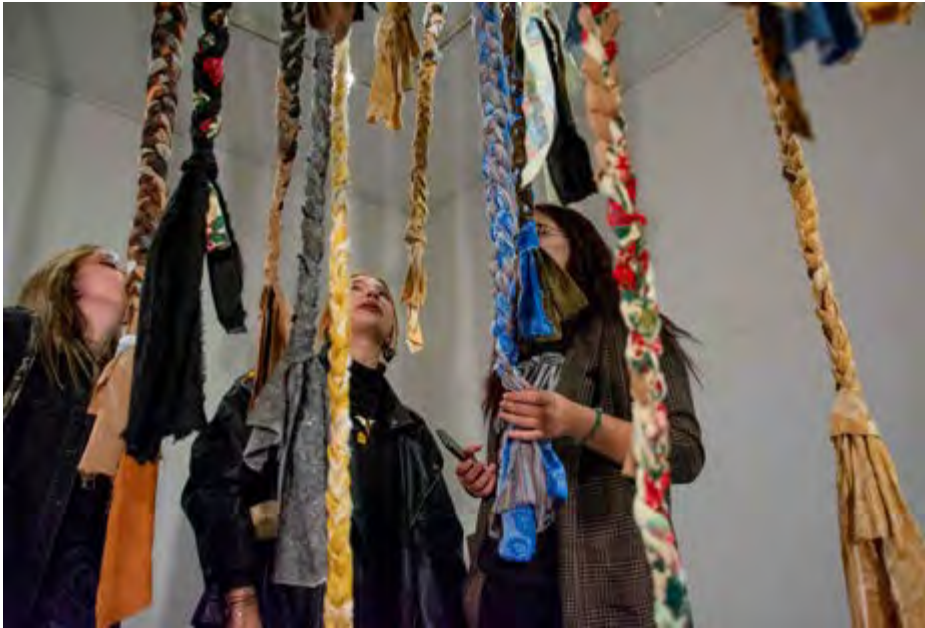
Darija Žmak Kunić: Iz ormara... (2022). Instalacija. 4.-12. listopad 2022 – samostalna izložba Iz ormara... Hrvatsko društvo likovnih umjetnika, Rijeka.

ih pletem ...« ... Dokumentirajući situiranost umjetnice lovila sam te kratke rečenice koje su svjedočile blizinu, gubitak, ranjivost, ali i upornu snagu da se traje i nastavlja sa stvaranjem.